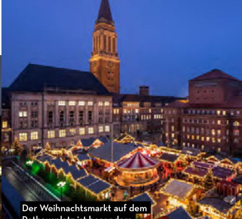
Der Weihnachtsmarkt auf dem Rathausplatz ist besonders idyllisch