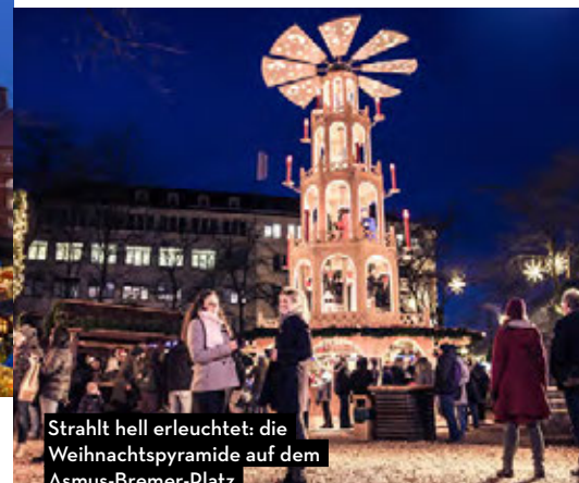
Strahlt hell erleuchtet: die Weihnachtspyramide auf dem Asmus-Bremer-Platz

Alle Jahre wieder weihnachtet es in Kiel.Sailing.City. Vier Märkte in der Kieler Innenstadt, ein Markt in der Holtenauer Straße sowie das Stadtwerke Eisfestival am neuen Standort Germaniahafen laden allesamt mit ihrem eigenen Charme zum Flanieren ein. Darüber hinaus zieht mit dem Riesenrad „La Noria“ 2024 eine neue Attraktion auf den Bahnhofsvorplatz des Hauptbahnhofs.