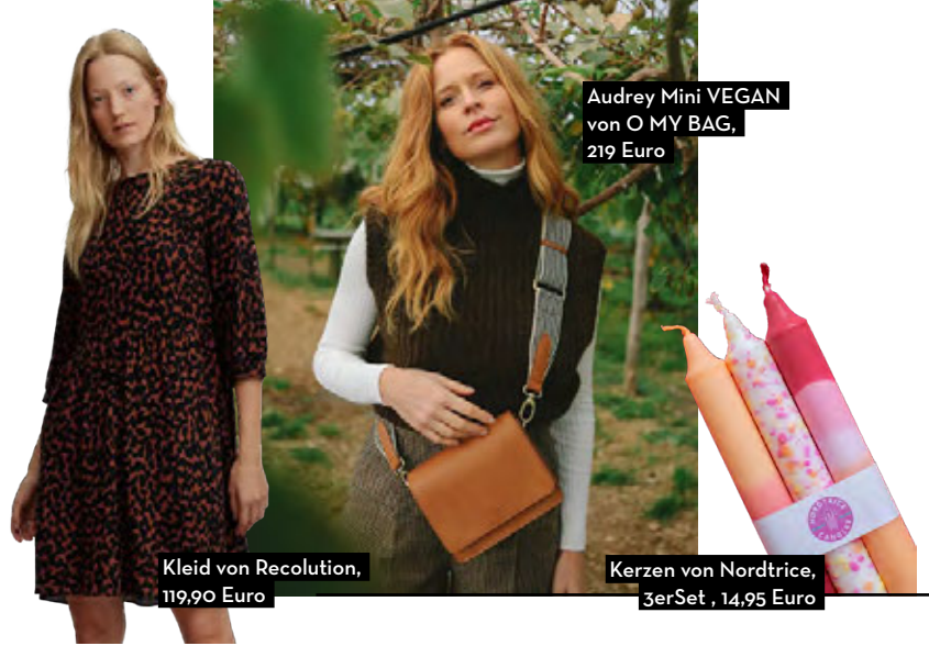
Kleid von Recolution, 119,90 Euro